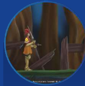
Game untuk Memperkenalkan Pahlawan Nasional