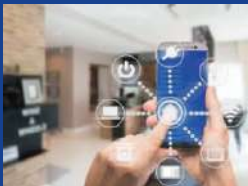
Network and Computer Technology (NCT)