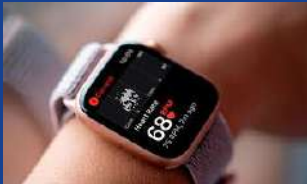
Biomedical Engineering (BE)