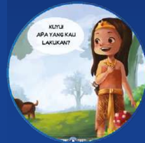
Motion Comic Dongeng Tradisional