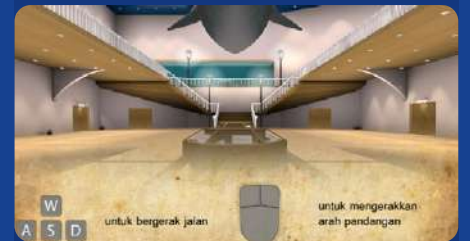
Museum 3D Hewan Dilindungi