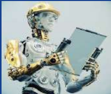
Intelligent Robotics (IR)